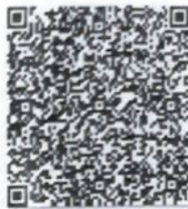
代伍英的年检二维码.png

本证书经检验合 This certificate is v this renewal.