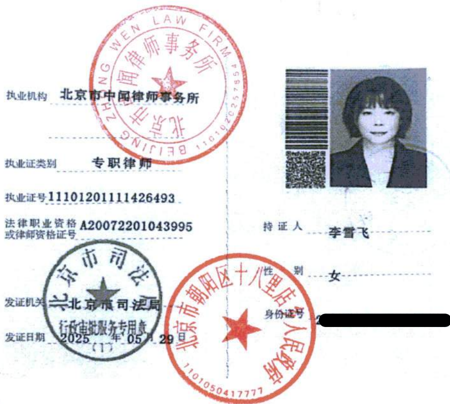
律师年度考核备案