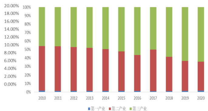
图 2：2010~2020 年天津市三次产业结构