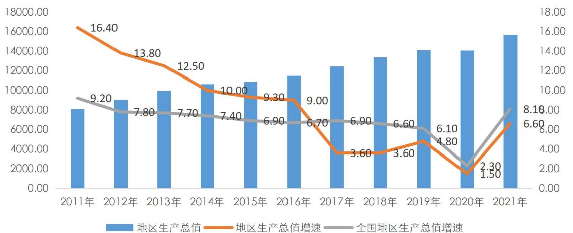
图表 4 天津市地区生产总值及增速情况（单位：亿元、%）

近年来天津市地区生产总值恢复增长，地区经济实力不断增强。2019 年~2021 年，天津市地区生产总值分别为 14104.28 亿元、14083.73 亿元和 15695.05 亿元，同比分别增长 4.8%、1.5%和 6.6%。受环保整治、工业转型和新冠疫情等因素影响，近年来天津市经济增速较为低迷；2019 年以来，天津市制造业高质量发展步伐加快，优势支柱产业不断更新迭代，承接北京非首都功能疏解成效显著，区域经济呈现回升趋势。2021 年随着疫情防控和全面复工复产的持续推进，天津市经济恢复取得明显成效，经济增速显著提高。