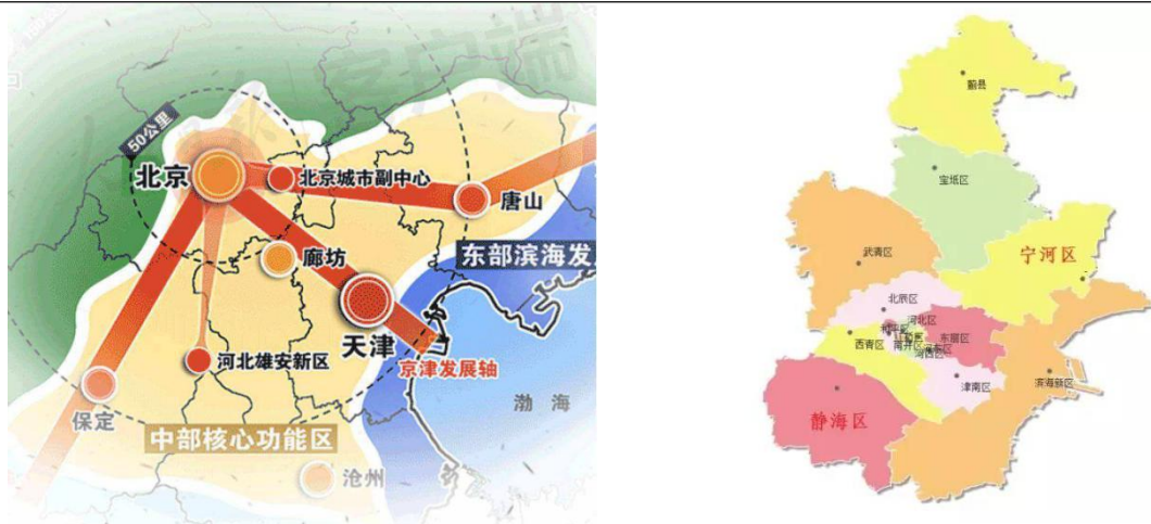
图表3 天津市区位图

根据《京津冀协同发展规划纲要》，天津市定位为“全国先进制造研发基地、北方国际航运核心区、金融创新运营示范区、改革开放先行区”，在实现京津冀优势互补、促进环渤海经济区发展、带动北方腹地发展方面具有重要战略地位。