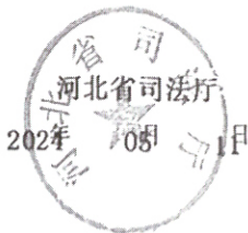
律师事务所变更登记（八）