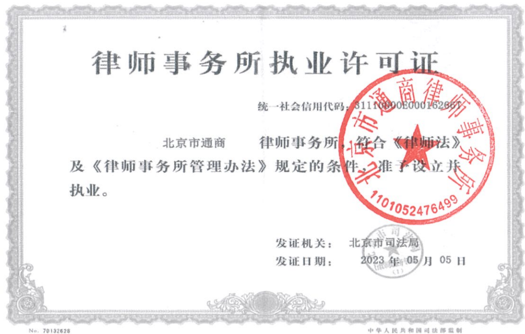
附件1：律师事务所执业许可证