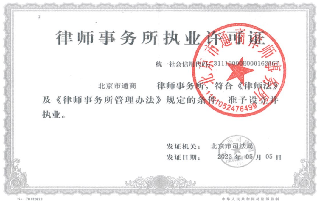
附件1：律师事务所执业许可证