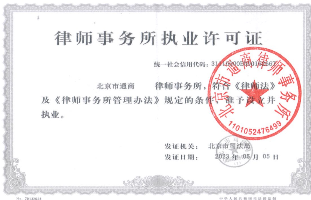
附件1： 律师事务所执业许可证