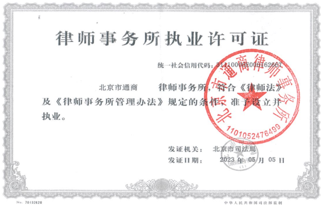
附件1：律师事务所执业许可证