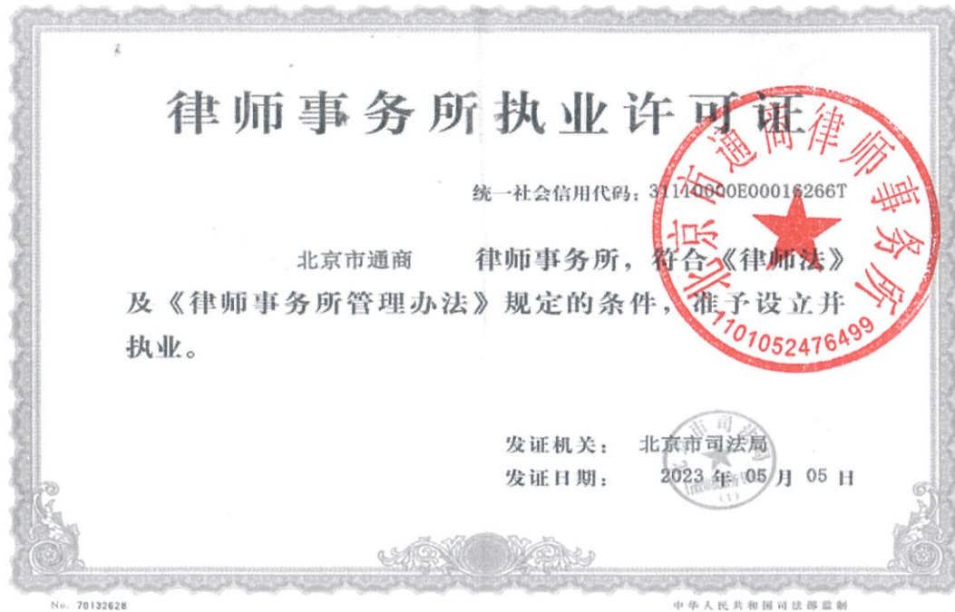
附件1：律师事务所执业许可证