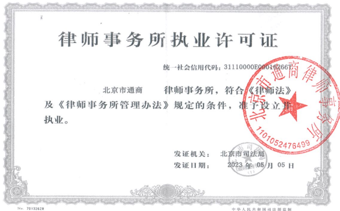
附件1：律师事务所执业许可证