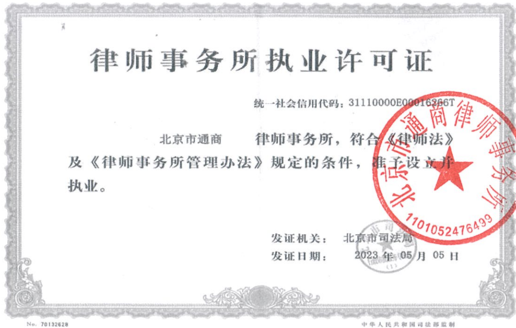
附件1：律师事务所执业许可证