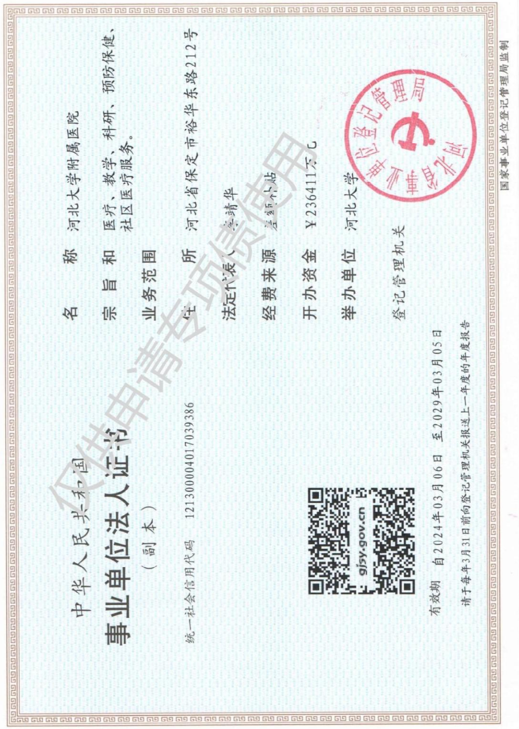
附件1：事业单位法人证书