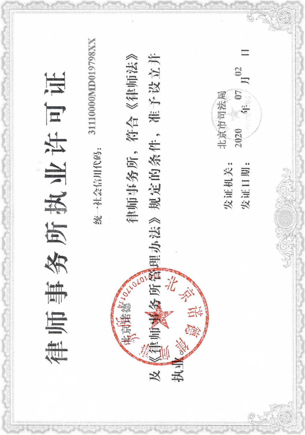
附件 1：律师事务所执业许可证