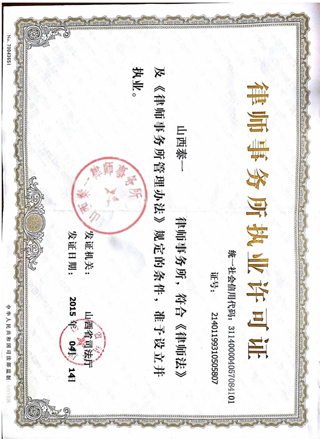
附件一：律师事务所执业许可证