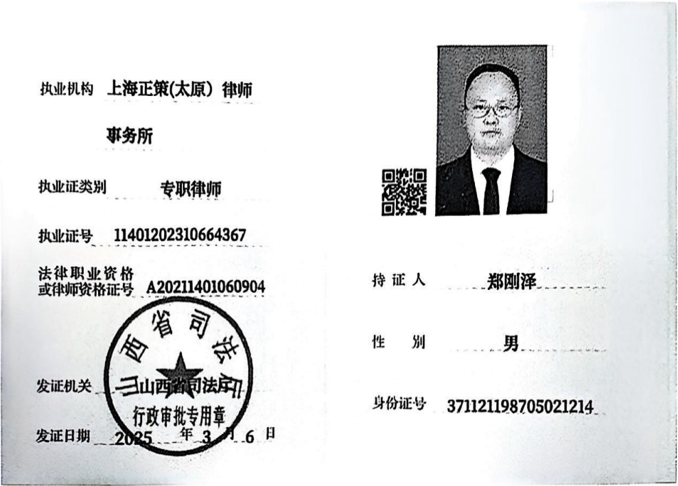
律师年度考核备案