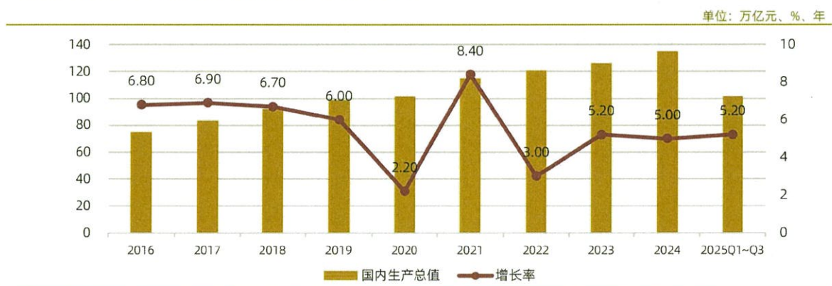
图表2：2016~2025年前三季度我国国内生产总值及增长率