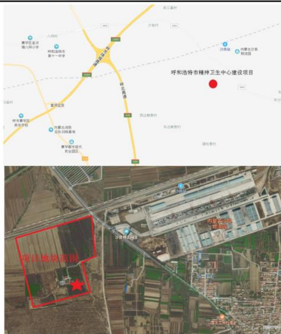
项目建设位置及地块范围示意图