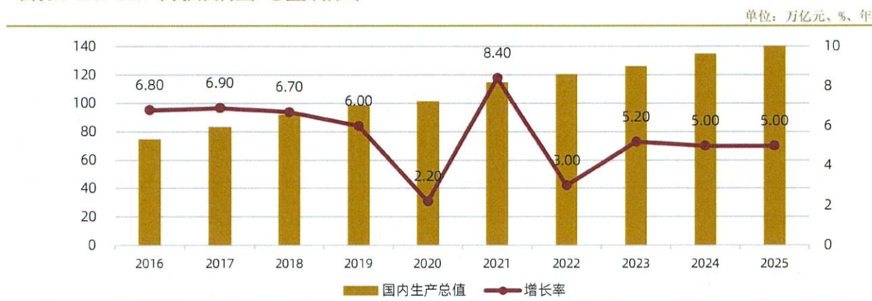
图表1：2016~2025年我国国内生产总值及增长率