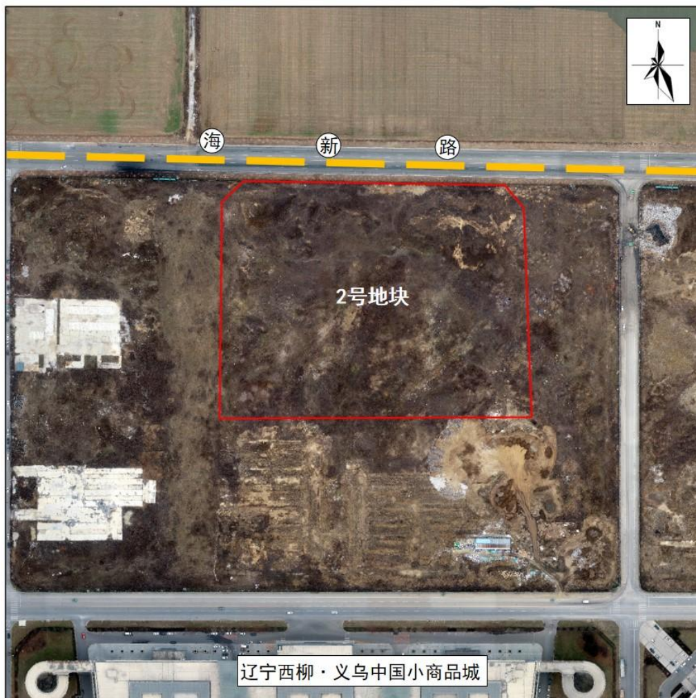
图3-2 2号地块现场情况示意图