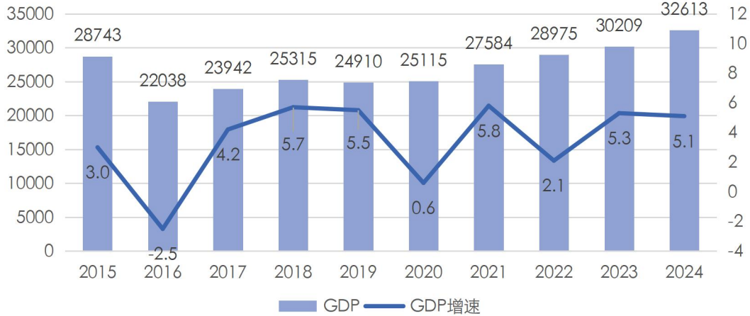
图表2 辽宁省经济总量及增速情况（单位：亿元、%）

根据地区统一核算结果，2025年，辽宁省地区生产总值33182.9亿元，同比增长3.7%。