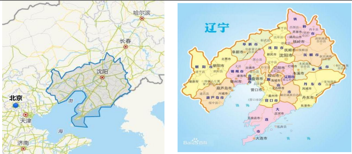
图表 1 辽宁省区位图