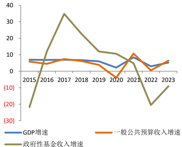
图 2：2015 年以来全国 GDP、一般公共预算收入、政府性基金收入增速（%）