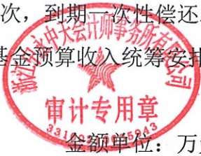
债券还本付息安排表

本项目融资到期本息总计 70491.50 万元。半年付息一次，到期一次性偿还本金，项目收益实现前，项目融资还本付息资金通过政府性基金预算收入统筹安排。