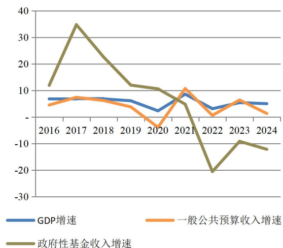
图 2：2016 年以来全国 GDP、一般公共预算收入、政府性基金收入增速（%）