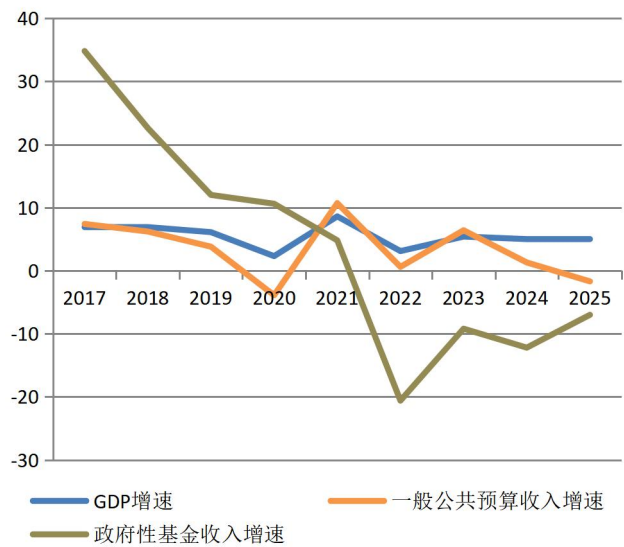
图 2：2017 年以来全国 GDP、一般公共预算收入、政府性基金收入增速（%）