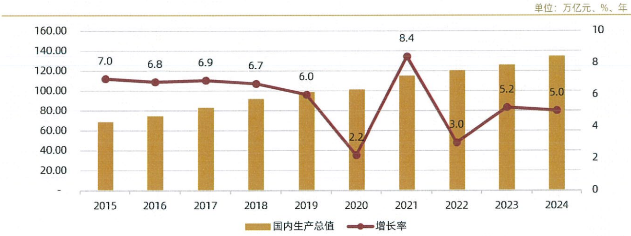
图表2：2015~2024 年我国国内生产总值及增长率

我国宏观经济运行稳中有进，但也面临着多重风险挑战。从外部环境来看，全球地缘形势动荡，大国博弈压力不减，全球经济与贸易运行依然面临较大不确定性。从内部经济运行来看，国内需求不足的问题尚待进一步缓解，部分企业生产经营存在一定困难，经济结构调整与新旧动能转换过程中的阵痛仍存。在此背景下，2025年宏观经济政策将加大逆周期调节，财政政策将在赤字率调升、特别国债扩大、专项债扩围等多个层面发力提效，货币政策将通过呵护流动性合理充裕、引导实体融资成本进一步下行等措施持续推动“宽信用”。