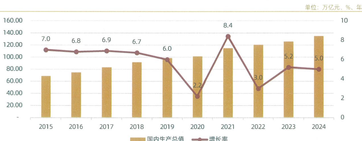
图表1：2015~2024年我国国内生产总值及增长率

2024年中国经济运行总体平稳，并呈现出较强的韧性，四个季度的经济运行节奏呈“U型”走势。其中，在内需偏弱的拖累下，二、三季度经济运行边际走弱，但在7月及9月中央政治局会议两次加力部署增量政策的支撑下，四季度我国宏观经济显著回升，同比增长5.4%，相较三季度加快0.8个百分点。在四季度宏观经济稳中有升的过程中，消费和服务业回升势头更强，或表明经济产需两端的正向循环趋势正在逐步确立。从宏观经济运行的主要经济指标来看，2024年中国经济运行体现出以下特征：一是工业与服务业生产保持韧性，高技术相关的生产增速较高；二是固定资产投资内部分化，出口对于制造业投资形成了较强拉动；三是价格水平总体偏低，但核心CPI好转反映出内需边际改善；四是企业、居民、政府三大主体收入状况皆有一定好转。