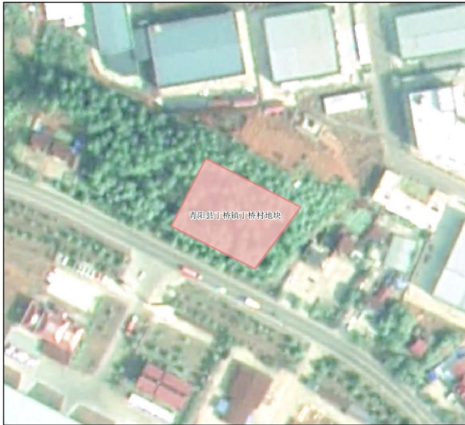
图 4 创新科技项目丁桥镇地块示意图