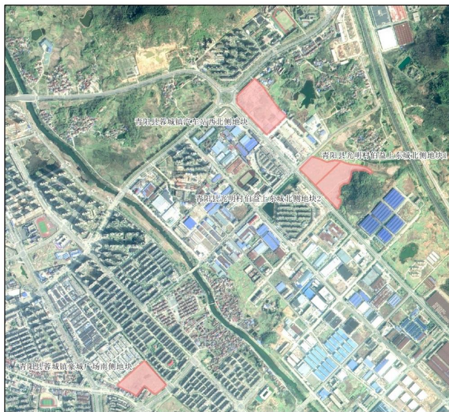
图 3 创新科技项目蓉城镇地块示意图

实施期限：项目开始实施日期为 2025 年 6 月，预计于 2025 年 12 月前完成收储，2030 年 12 月前完成出让。