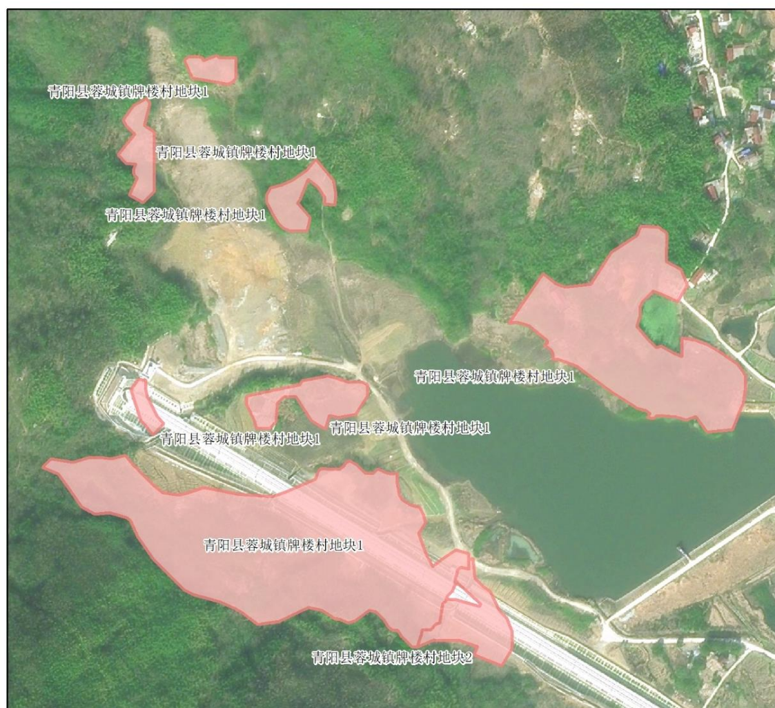
图 3 旅游服务业项目地块示意图

实施期限：项目开始实施日期为 2025 年 6 月，预计于 2025 年 12 月前完成收储，2030 年 12 月前完成出让。