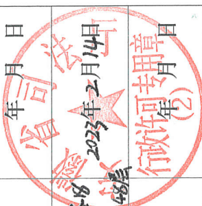
所属律师事务所变更登记备案（二）