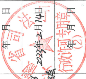
所属律师事务所变更登记备案（二）