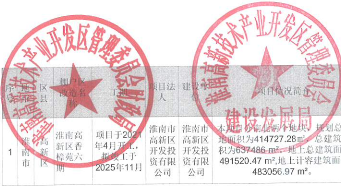
棚户区改造项目一览表