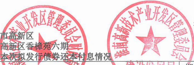
棚改专项债基本情况明细表