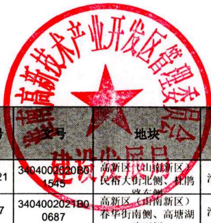
棚改项目周边土地出让明细表