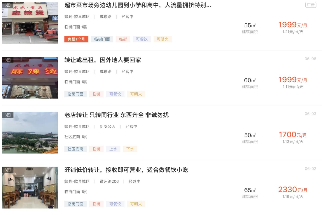
图 4 交易集散中心出租费收入价格参考

参考黄山 58 网商铺出租情况，歙县商铺月出租费一般为 33.30 元/m 2 —36.30 元/m 2 ，基于谨慎性原则，经营期第 1 年本项目交易集散中心每月出租费按 33.00 元/m 2 进行测算。