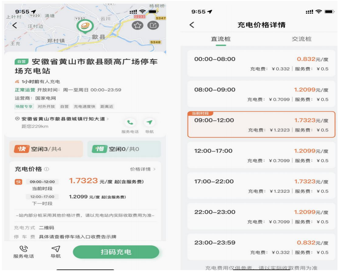
图 6 充电桩服务费收入价格参考

据《国家发展改革委关于电动汽车用电价格政策有关问题的通知》（发改价格〔2014〕1668 号）、《省物价局转发国家发展改革委关于电动汽车用电价格政策有关问题的通知》（皖价商〔2014〕102 号）等文件要求，电动汽车充电服务价格由“电费+充电服务费”组成。电费按国家和省价格部门电价政策规定执行，充电服务费实行政府指导价管理，由价格主管部门制定中准价格和上下浮动幅度确定。参考国网安徽省黄山市歙县颐高广场停车场充电站价格数据，本项目充电桩服务费按 0.50 元/kW·h 测算。