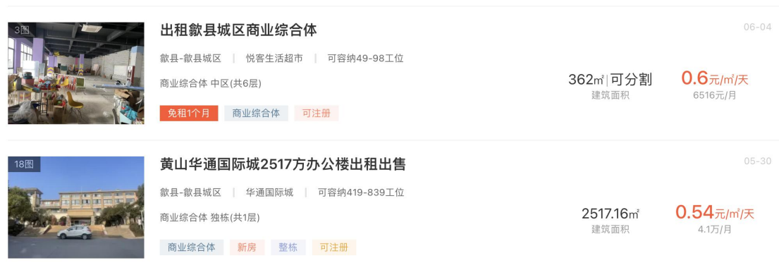
图 3 综合服务中心出租费收入价格参考

参考黄山 58 网写字楼出租情况，歙县写字楼月出租费一般为 16.20 元/ \text{m}^2 —18.00 元/ \text{m}^2 ，基于谨慎性原则，经营期第 1 年本项目综合服务中心每月出租费按 16.00 元/ \text{m}^2 进行测算。