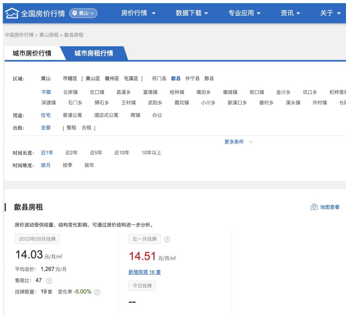
图 2 职工宿舍出租费收入价格参考

参考全国房价行情网歙县住宅出租价格情况，歙县住宅出租费一般为 14.03 元/m 2 —14.51 元/m 2 ，基于谨慎性原则，经营期第 1 年本项目职工宿舍每月出租费按 14.00 元/m 2 进行测算。