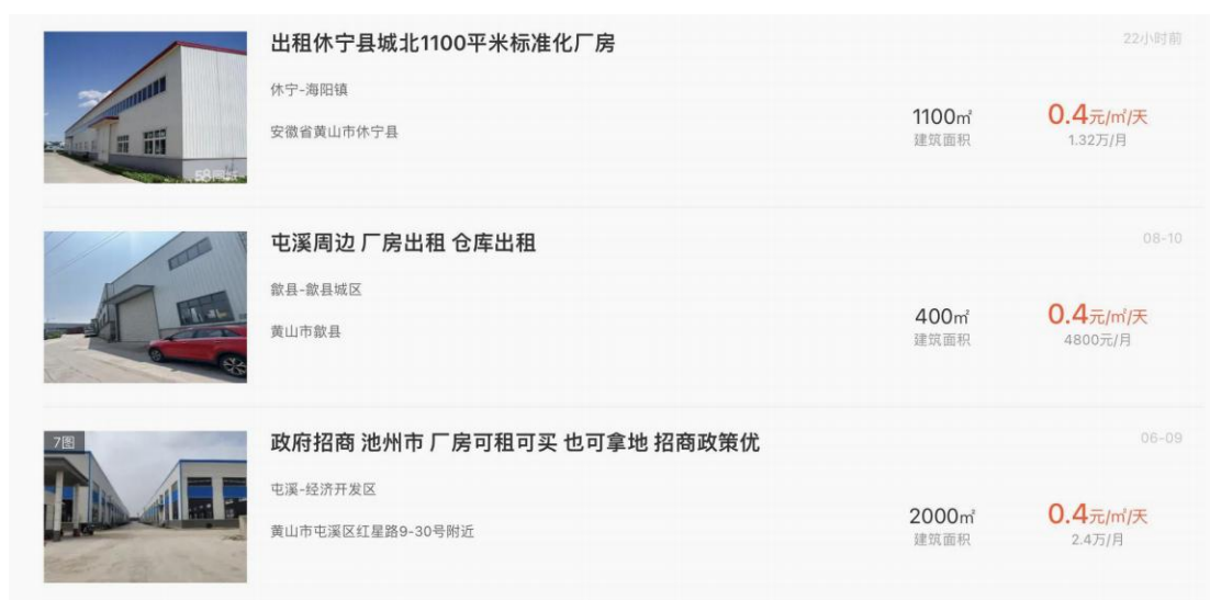
图 1 标准化厂房出租费收入价格参考

参考黄山 58 网厂房出租情况，黄山市厂房月出租费一般为 12.00 元/m 2 ，基于谨慎性原则，经营期第 1 年本目标化厂房每月出租费按 12.00 元/m 2 进行测算。