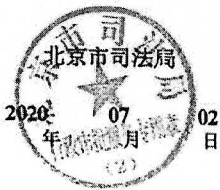
律师事务所年度检查考核记录