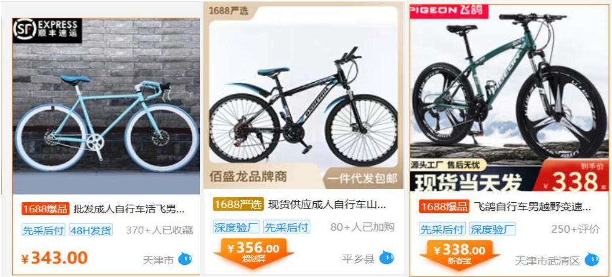
1688 自行车购买价 338-356 元

续更新费用。参照 1688 网自行车购买价格 338-356 元，基于谨慎性考虑，本项目自行车购买价格按 480 元/辆计算，采购价格每三年增长 5%。参考同类行业数据，基于谨慎性考虑，本项目自行车更新率按照每年 250 辆自行车的 30%购置新车作为自行车的后续更新费用，并保持每年 3%的比例增加。