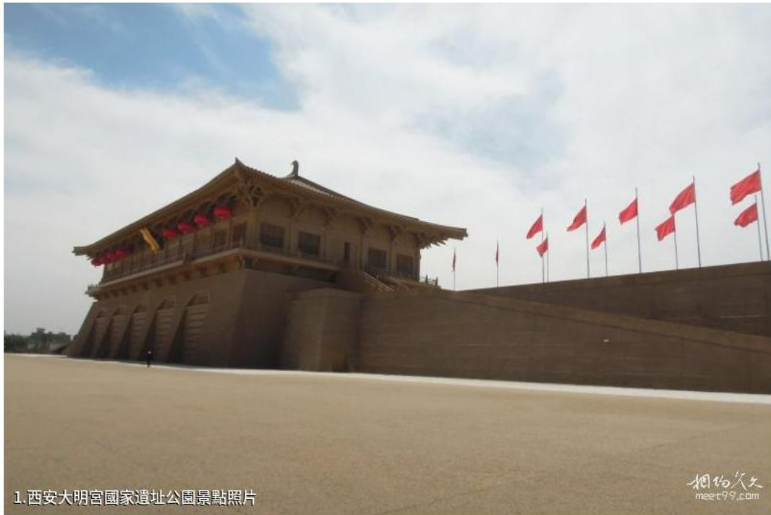
1. 西安大明宮國家遺址公園景點照片