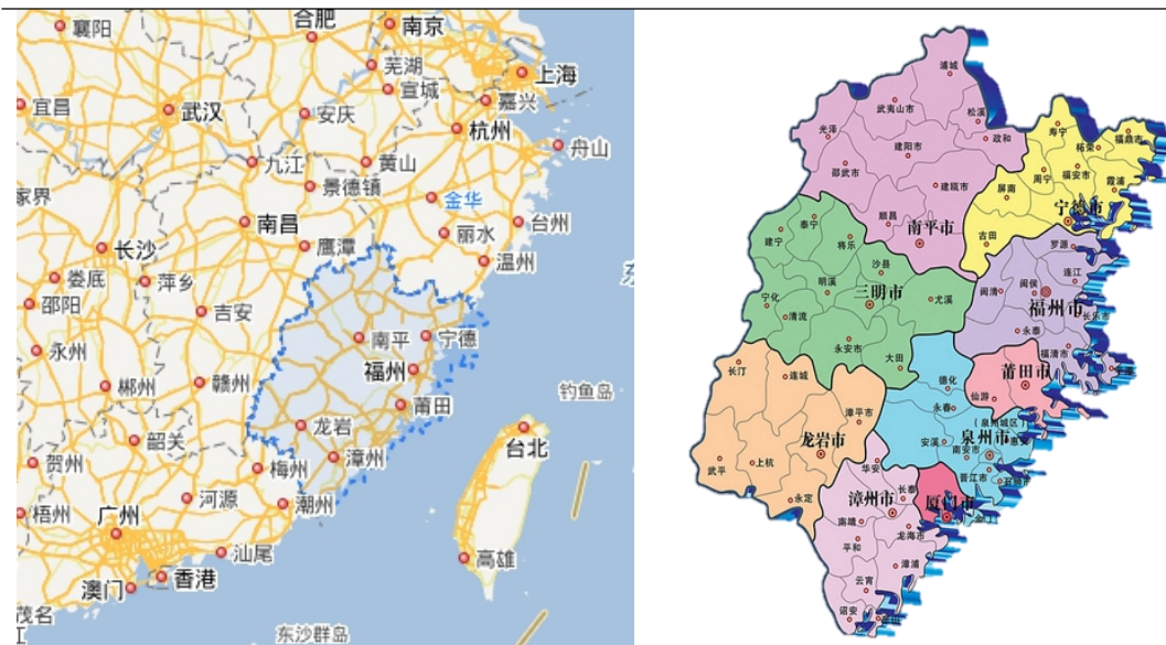
图表 3 福建省区位图

在对外交流方面，2015 年以来，中欧班列（厦门）累计开行 1000 余列；2018 年 3 月，中国首条跨东南亚六国 4 “一带一路”航线在厦门国际邮轮母港启航；2022 年，泉州市、龙岩市、福州市相继开通首条中欧班列。中欧班列及“丝路海运”航线加强了福建省与“一带一路”沿线国家及地区的往来，使得福建省成为陆上丝绸之路与海上丝绸之路的重要对接区域。