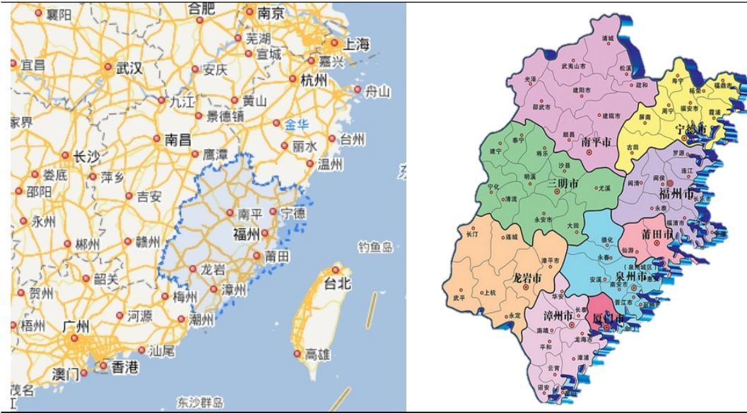
图表 2 福建省区位图