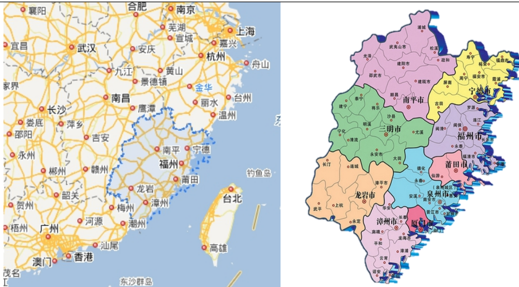
图表2 福建省区位图

在对外交流方面，2015年以来，中欧班列（厦门）累计开行1300余列；2018年3月，中国首条跨东南亚六国 4 “一带一路”航线在厦门国际邮轮母港启航；厦门市、南平市、龙岩市、泉州市、宁德市和福州市相继开通首条中欧班列。中欧班列及“丝路海运”航线加强了福建省与“一带一路”沿线国家及地区的往来，使得福建省成为陆上丝绸之路与海上丝绸之路的重要对接区域。2018年以来，从福建出发的“丝路海运”航运国际物流平台在基础设施硬联通、规则标准软联通等方面取得了一系列成果。2023年，福建“丝路海运”海铁联运“天天班”实现了福建厦门—江西向塘次日达，“丝路海运”命名航线总数已达116条，构建起联通全球43个国家和地区131个港口的航线网络。2023年，中印尼、中菲经贸创新发展示范园区获批在福建设立，探索建立产业互联、设施互通、政策互惠的双园结对合作机制；中国-金砖国家新时代科创孵化园在厦门揭牌运行，为金砖国家科技创新和产业合作提供支撑；中国（福建）自由贸易试验区获批对接国际高标准推进制度型开放试点，新推出全国首创举措26项。