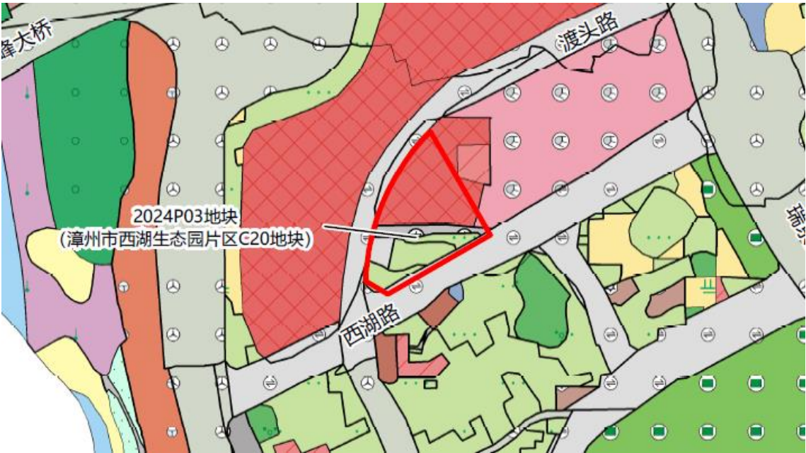
图 2 土地利用现状局部图

注：1.地块标识码：为全民所有土地资产管理信息系统生产的地块标识码；2.乡（镇、街道）：包含多个权属性质的全部列出；3.村委会、居委会：包含多村委会、居委会的全部列出；4.权属性质：填写国有、集体，包含多个权属性质的全部列出；5.地块面积等于农用地、建设用地、未利用地面积之和。