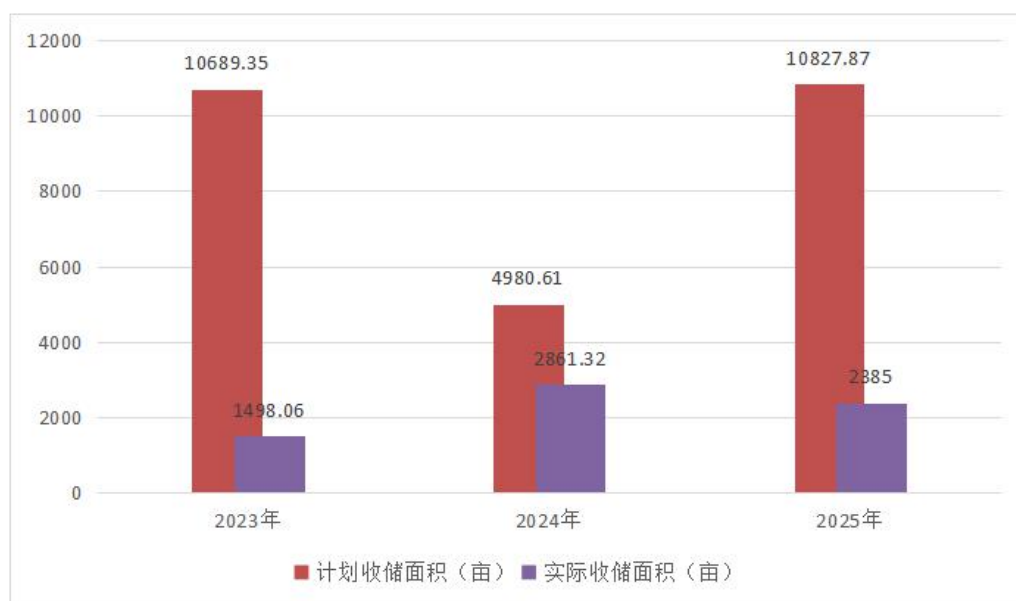
图 1 近三年（2023-2025）市本级收储情况变化趋势图

从规模上看，除 2024 年计划收储土地面积较低外，2023 及 2025 年计划收储面积较为一致；从执行率上看，实际收储用地面积略有波动；从储备土地来源上看，主要以批次农转征为主的新增建设用地；从实施收储土地分布上看，仍主要集中在芄城区、龙文区、高新区中心城区范围内，路网发达，交通便利，周围环境较为优越的地块；从管理和临时利用上看，近三年入库储备土地均有开展管护及临时利用等工作。随着项目实际情况对收储计划进行中期调整以及对本年度市场情况预判的逐渐成熟，收储计划编制也逐渐朝着预期的调控效果发展。