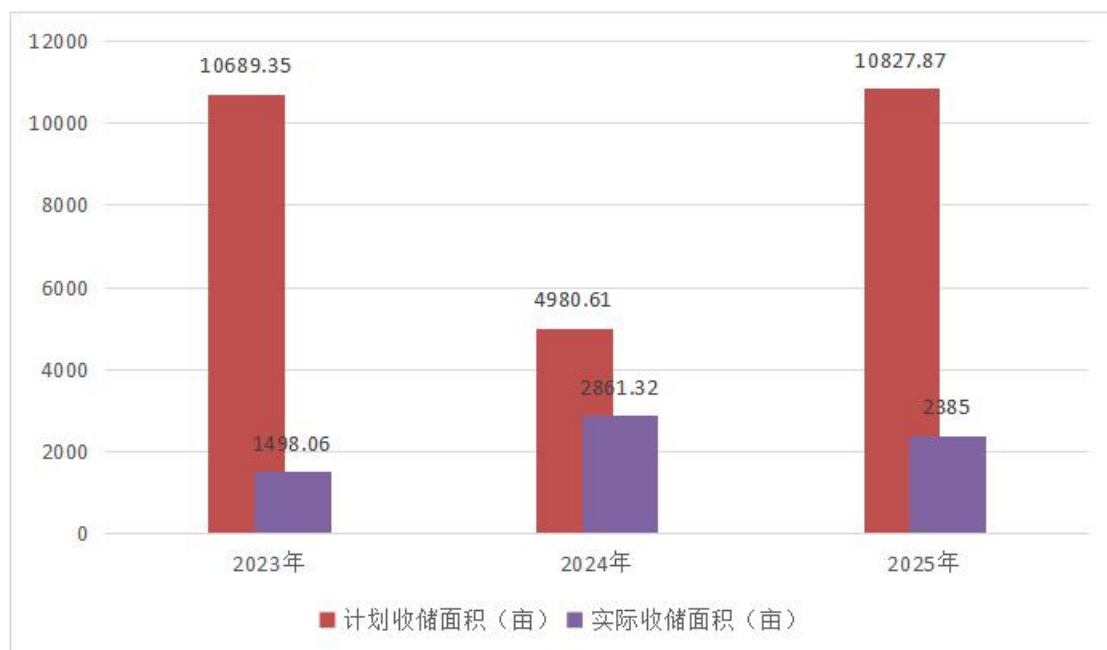
图 1 近三年（2023-2025）市本级收储情况变化趋势图

从规模上看，除 2024 年计划收储土地面积较低外，2023 及 2025 年计划收储面积较为一致；从执行率上看，实际收储用地面积略有波动；从储备土地来源上看，主要以批次农转征为主的新增建设用地；从实施收储土地分布上看，仍主要集中在芄城区、龙文区、高新区中心城区范围内，路网发达，交通便利，周围环境较为优越的地块；从管理和临时利用上看，近三年入库储备土地均有开展管护及临时利用等工作。随着项目实际情况对收储计划进行中期调整以及对本年度市场情况预判的逐渐成熟，收储计划编制也逐渐朝着预期的调控效果发展。