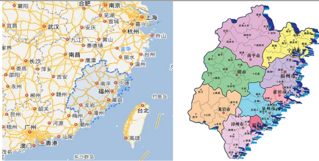
图表 2 福建省区位图

在对外交流方面，中欧班列及“丝路海运”航线加强了福建省与“一带一路”沿线国家及地区的往来，使得福建省成为陆上丝绸之路与海上丝绸之路的重要对接区域。厦门市、南平市、龙岩市、泉州市、宁德市和福州市等地市开通了中欧班列，形成覆盖俄罗斯、波兰、乌兹别克斯坦等“一带一路”共建国家的运输网络，通过海铁联运等创新模式，将“海丝”与“陆丝”无缝衔接，为福建及周边地区企业提供了高效的国际物流通道。从福建出发的“丝路海运”航运国际物流平台在基础设施硬联通、规则标准软联通等方面取得了一系列成果。2025 年，福建省新增 15 条“丝路海运”命名航线、14 家联盟成员，新开辟 5 条通往中西部多式联运线路。在文化交流方面，福建省发挥着连接两岸、联通世界的独特桥梁作用，特别是在对台交流、海丝文化传播、文化遗产保护等领域成果显著。2025 年，福建持续推进闽台人文交流，海峡两岸文博会、IM 两岸青年影展成功举办、世界闽南文化交流中心加快建设。