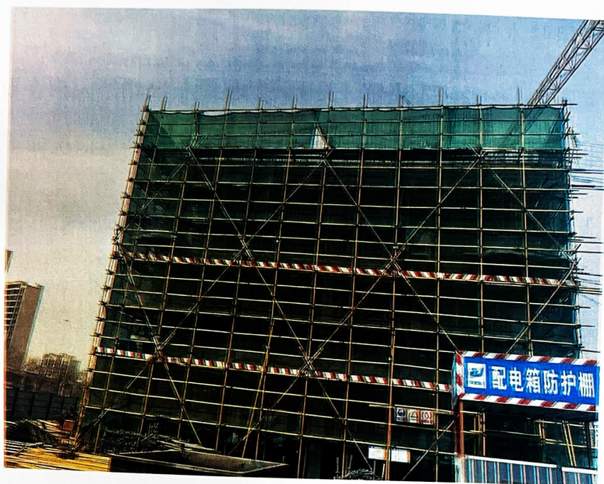
图 2-1 项目施工现场图