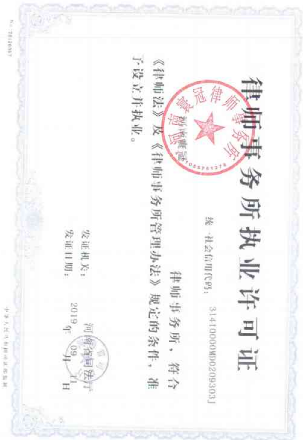
附件一：律师事务所执业许可证