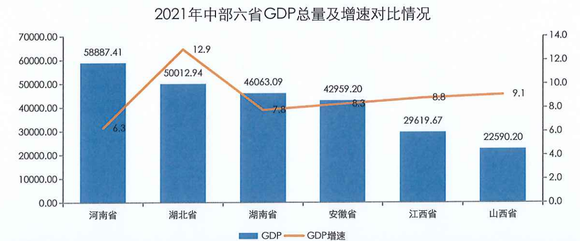
图表4 湖北省主要经济指标及对比情况（单位：亿元、%）