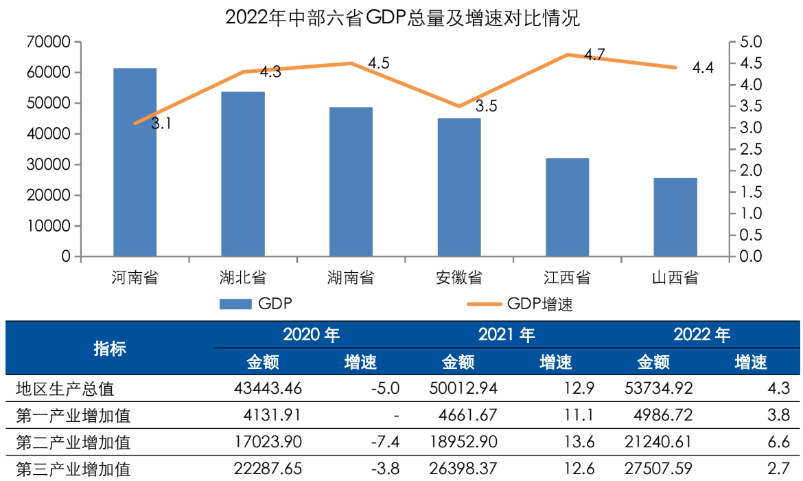
图表 3 湖北省主要经济指标及对比情况（单位：亿元、%）

资料来源：湖北省 2020 年~2022 年国民经济与社会发展统计公报，东方金诚整理