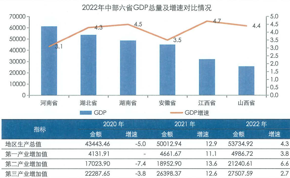
图表2 湖北省主要经济指标及对比情况（单位：亿元、%）