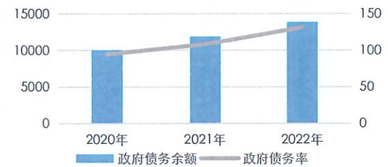
湖北省政府债务余额及政府债务率 (单位: 亿元、%)