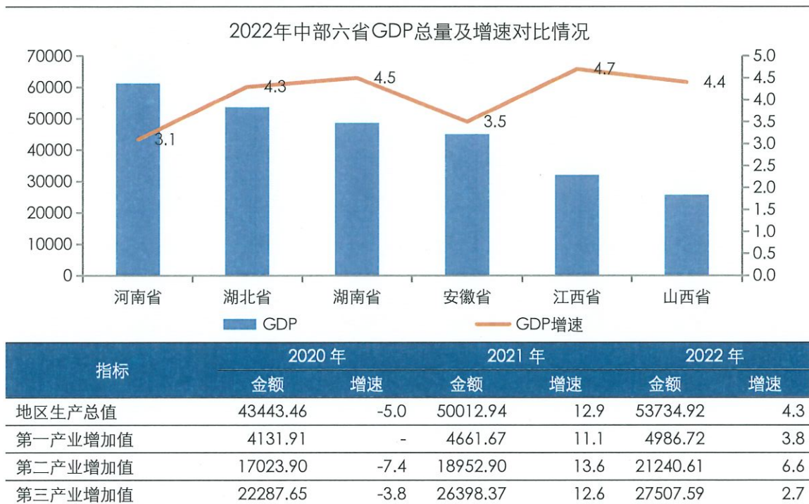
图表 2 湖北省主要经济指标及对比情况 (单位: 亿元、%)

资料来源: 湖北省 2020 年~2022 年国民经济和社会发展统计公报, 东方金诚整理